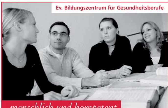
Ev. Bildungszentrum für Gesundheitsberufe